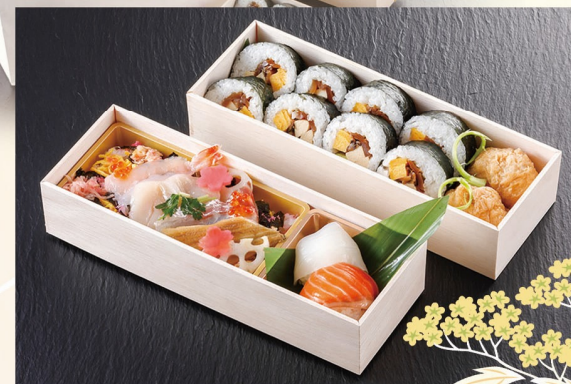
「折箱寿司盛り」 3,000円(税込)

大切なお客様へ、ワンランク上のお土産品で お礼の気持ちを伝えませんか。 3日前までに要ご予約