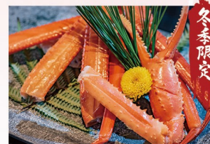
浜茹で香住かに(半匹) 2,200円(税込)