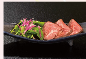
ローストビーフ 700円(税込)