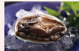
アワビ陶板焼き 2,200円(税込)